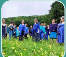
Chœur de femmes