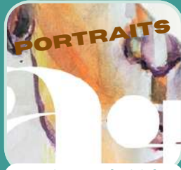
Atelier de créativité